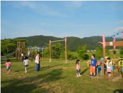
アスレチック広場